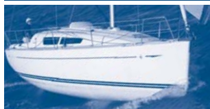
Sun Odyssey 30i