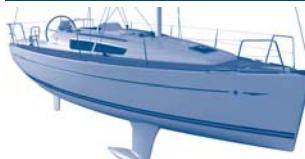
Sun Odyssey 33i