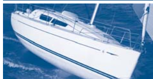
Sun Odyssey 30i Performance